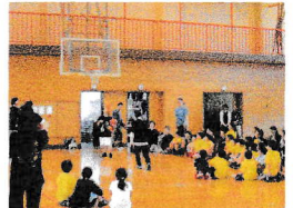
バスケット少年団