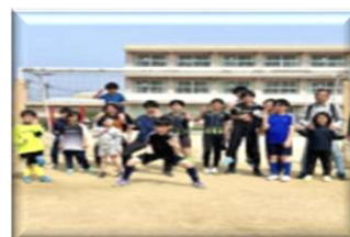
サッカークラブ 土曜：白岡東小校庭