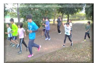
かけっこクラブ 日曜：高岩公園