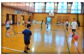
ソフトテニス 月曜：白岡東小体育館 金曜：勤体テニスコート