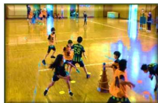
チャレンジC：鬼スポ 木曜：白岡東小体育館